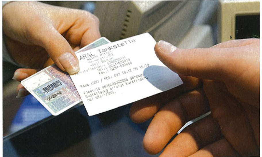
Einfacher als tanken: Wer Fleet-ID verwendet, lässt seinen Führerschein an der Aral-Station checken.

Fleet Innovation geht mit Fleet-ID dahin gehend einen eigenen Weg, indem das Fuhrparkmanagement-Unternehmen keinen Chip, sondern einen Hologramm-Barcode auf den Führerschein klebt. Auch dieser soll fälschungssicher sein, die Eingabe der Daten erfolgt in der Fleet-ID-Datenbank. Besonders komfortabel: Dank der Kooperation mit Aral können Dienstwagenfahrer ihren Führerschein an gut 2.500 Tankstellen in Deutschland vorzeigen – der Check erfolgt per Barcode-Scanner an der Kasse. Fleet-ID erinnert an Prüftermine und informiert über die durchgeführten Kontrollen. Die Daten wandern in Echtzeit auf die Fleet-ID-Datenbank, wo sie der Flottenverantwortliche jederzeit einsehen kann, der Fahrer erhält zudem an der Kasse einen ausgedruckten Beleg. Die Preise: Einmalig