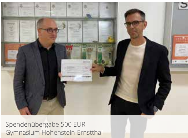
Spendenübergabe 500 EUR Gymnasium Hohenstein-Ernstthal

Mit dieser Aktion hat sich KEMAS in der Region als zukünftiger Ausbildungsbetrieb oder Arbeitgeber positioniert und konnte die Bekanntheit steigern.