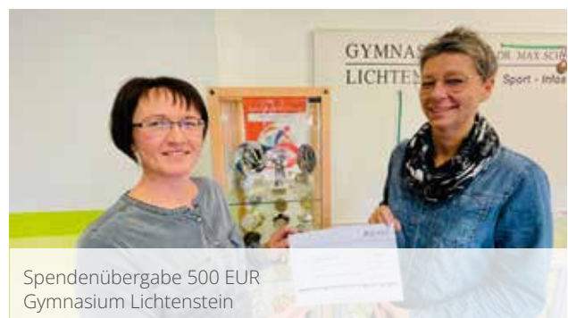
Spendenübergabe 500 EUR Gymnasium Lichtenstein