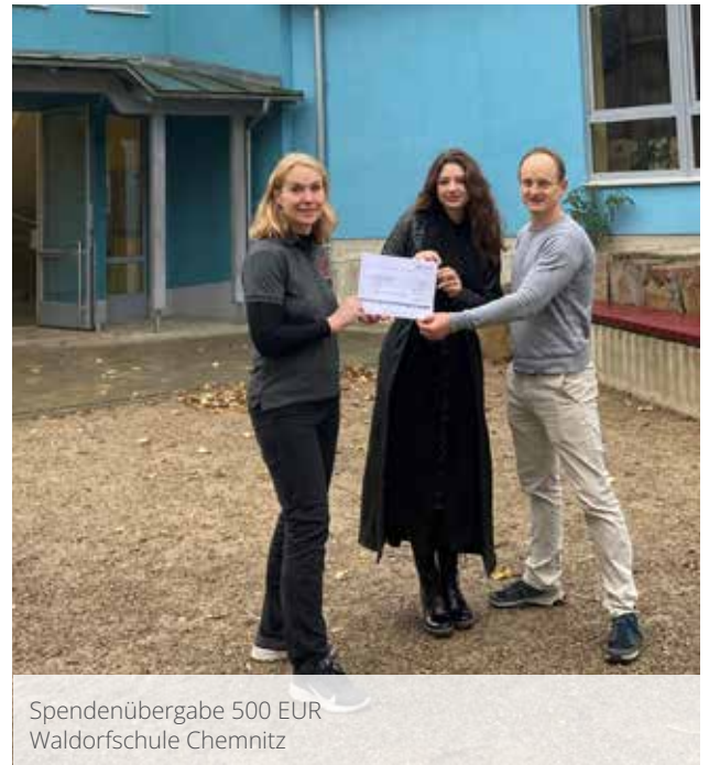
Spendenübergabe 500 EUR Waldorfschule Chemnitz