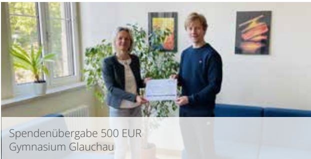
Spendenübergabe 500 EUR Gymnasium Glauchau