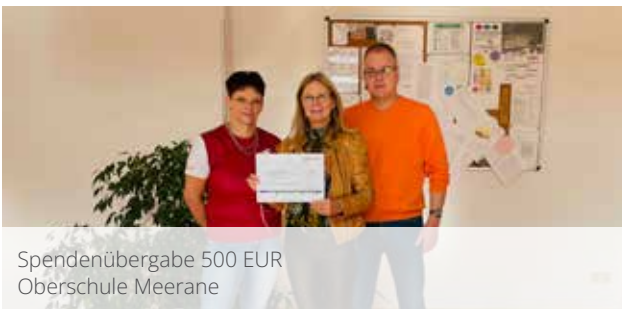
Spendenübergabe 500 EUR Oberschule Meerane