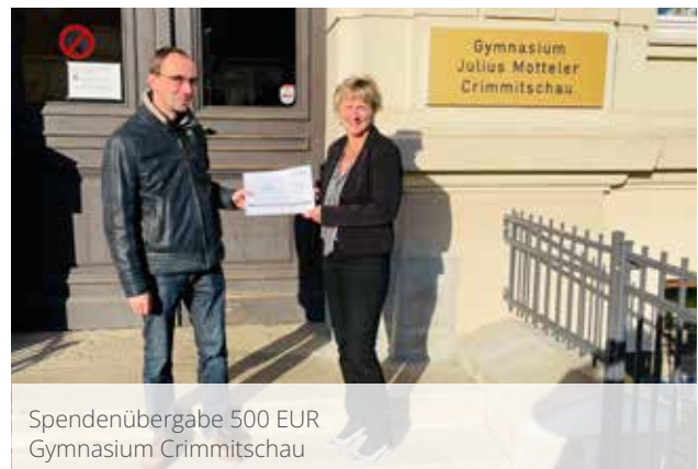
Spendenübergabe 500 EUR Gymnasium Crimmitschau

Allein an diesem Event beteiligten sich über 40 Sportler:innen. Nach dieser Aktion war die angestrebte Punktzahl erreicht und sogar übererfüllt.